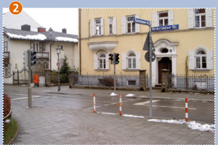
2 Druckknopfampel: Haimhauserstraße/Biedersteiner Straße