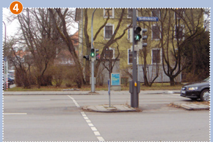
4 Fußgängerübergang/Ampelanlage: Dietlindenstraße/Biedersteiner Straße