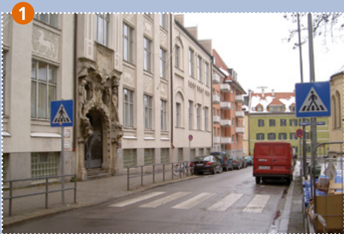
1 Zebrastrreifen vor dem Schulhauseingang: Haimhauserstraße