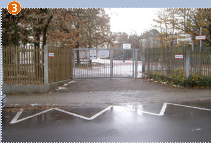
3 Schulhofzugang, Gohrenstraße: Zur Zeit wegen Umbaumaßnahmen gesperrt